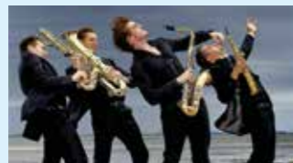
SIGNUM SAXOPHONE QUARTET