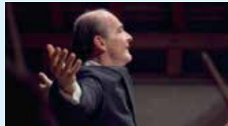
GÁBOR TAKÁCS-NAGY