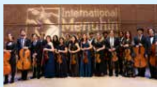
SOLISTES DE L'ACADÉMIE MENUHIN