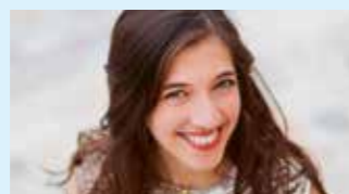
CAMILLE THOMAS