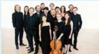
CHAARTS CHAMBER ARTISTS