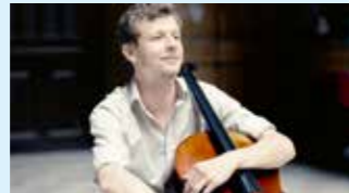
ISTVAN VARDAI © nagy felbontású