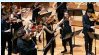
ORCHESTRE DE CHAMBRE DE LA HEM