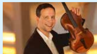
MATÉ SZÜCS © dr