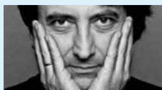
JEAN-EFFLAM BAVOUZET