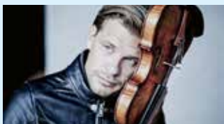
KIRILL TROUSSOV