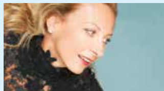
NATHALIE DESSAY